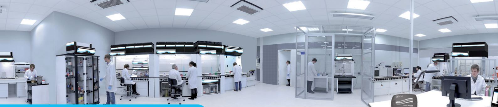
Le laboratoire de Recherche et Développement Erlab